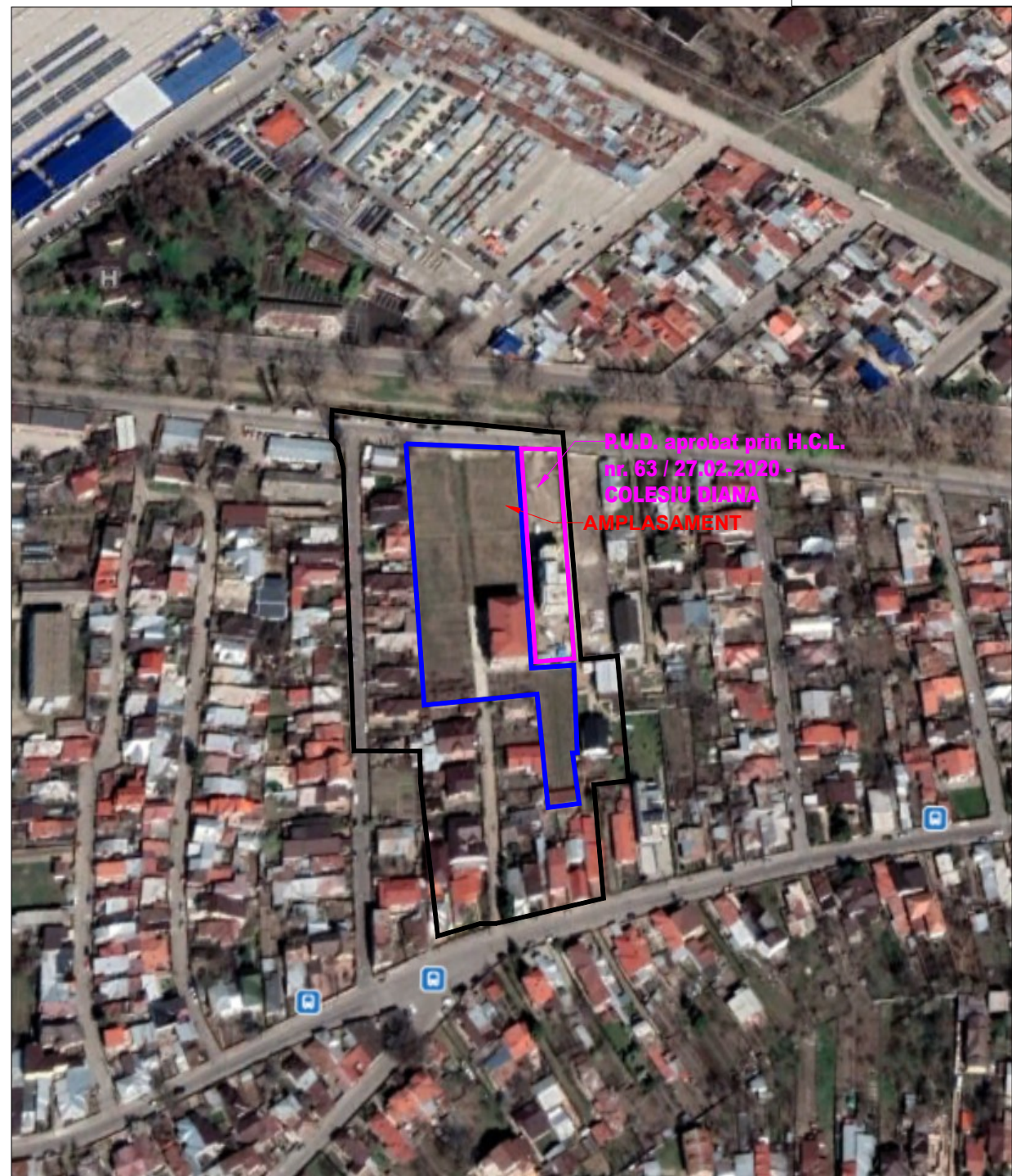
PLAN INCADRARE IN STATELIT sc 1:5000